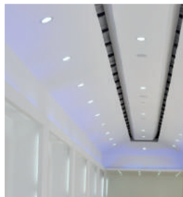
REBAJADO DE BORDES

Mediante un proceso de lijado, las placas obtienen superficies lisas, rectificadas, con espesores calibrados. Ideal para acabados muy finos en paredes interiores y fachadas.