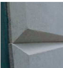
BISELADO DE BORDES

Se rebajan los bordes de las placas con el fin de facilitar el tratamiento de junta continua, logrando una rápida aplicación de masilla y mejores acabados.