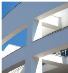
LIJADO DE SUPERFICIES

Placas en medidas a escuadra, totalmente precisas. Ideal para paredes y fachadas moduladas con junta a la vista.